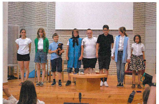
Kedves napló! Beszámoló a záróünnepségen