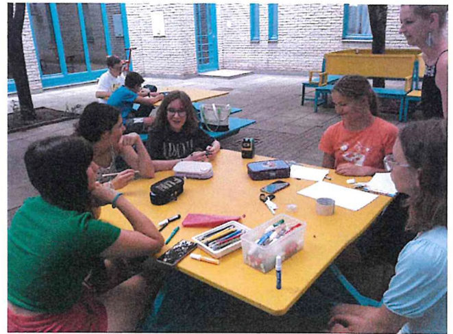
Munka közben a Gézengúzok és a Képirók