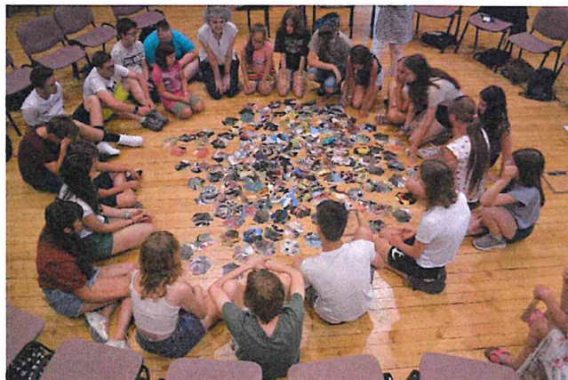
Megérkeztünk! – Ismerkedési játékok a Katona József Könyvtárban